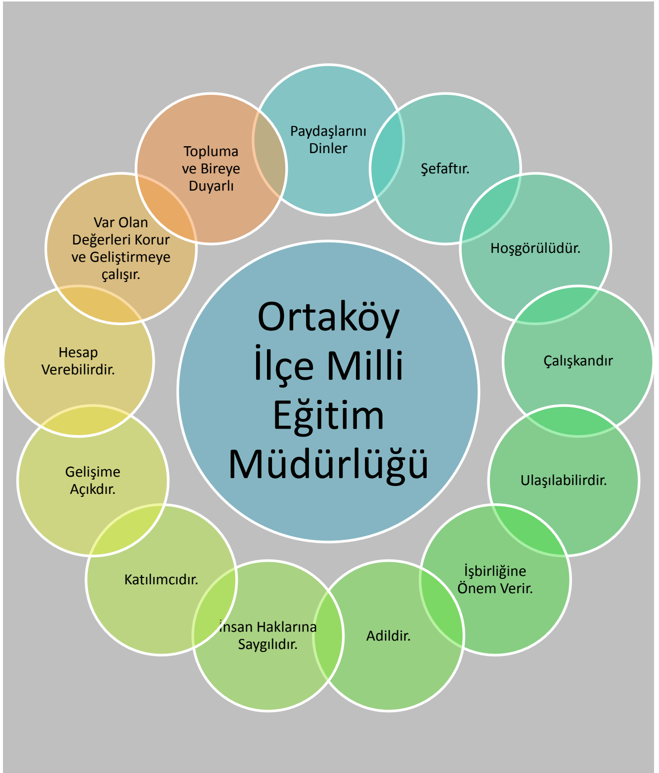
Şekil 3: Temel Değerler, İlkeler şeması

Müdürlüğümüzün çalışma felsefesi ve bu çalışmalara temel teşkil eden ilke ve değerler aşağıda gösterilmiştir.